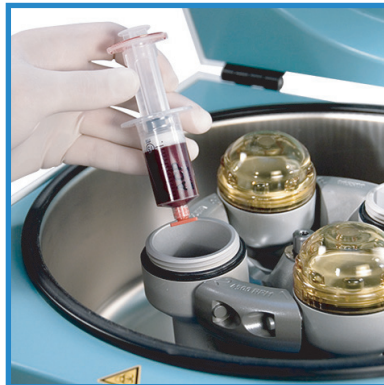
zpracování krve v centrifuze