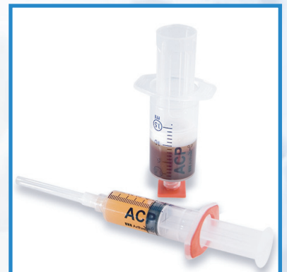
finální produkt, p ípravený k aplikaci