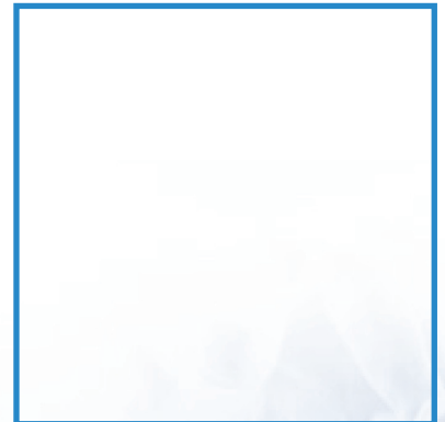
zpracování krve v centrifuze